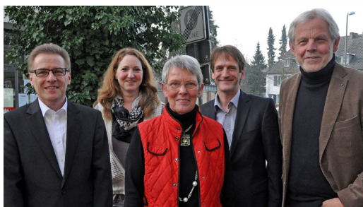
Der Vorstand des Hospiz-Freundeskreises Dorsten e.V.